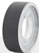
Keilrippenscheibe Poly-V-Profil Werkstoff gehärtetes Aluminium, Flanschausführung Ribbed belt pulley Poly-V profile Material hardened aluminium, flanged connection