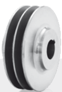
Keilriemenscheibe Profil SPB Werkstoff GG, zylindrische Bohrung mit Nut V-belt pulley Profile SPB Material GG (grey cast iron), cylindrical bore with groove