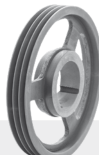
Keilriemenscheibe Profil SPA Werkstoff GG, für Taper-Spannbuchse V-belt pulley Profile SPA Material GG (grey cast iron), for tapered clamping bush